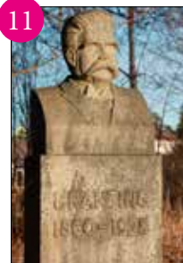
11 HJALMAR BRANTING (1860–1925) byst i granit av Torsten Bryngelsson (1904–1958). Branting var Socialdemokraternas förste ledare och statsminister i tre regeringar 1920–1925. PLATS: Folkets Park, till höger efter ingången från korsningen Parkgatan/Långgatan