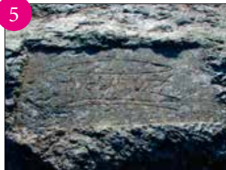
5 KUNGLIG NAMNTECKNING Gustav VI Adolf (1882–1973), skrev sin namnteckning på stenen när han på sin Eriksgata 10 september 1955 besökte Hallstahammar och kyrkan. PLATS: Till höger om ingången till S:t Lars kyrka