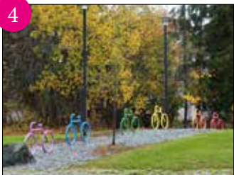
4 ”BULTENSTRÖMMEN” Symbol för skiftbytet för arbetarna på Bulten. Konstinstallation med sex cyklar i olika färger, efter en idé av Jimmy Robertson. PLATS: Rondellen vid ”Bultbacken”, Nygatan