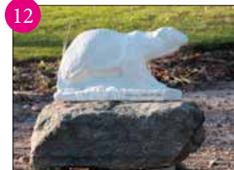
12 ISBJÖRN Skulptur i kalksten av Georg Ganmar (1916–1979). Ganmar föddes i Hallstahammar och arbetade som formgiutare på Kanthal innan han utbildade sig till skulptör. PLATS: Fontänen i Centrumparken