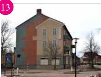
13 NYHAMN Väggmålning, putsad fasad efter en idé av Christer Iwemyr och ett utvecklat och förfinat förslag av Kolbäckarkitekten Ronny Sundqvist. Målade av Västfasad 1998. PLATS: Sagabiografen, Storgatan, södra gaveln