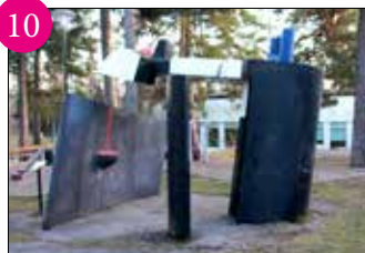
10 POETISK MASKIN i glasfiber av Olle Adrin, 1967. PLATS: Parkskolan, innanför förskolans staket